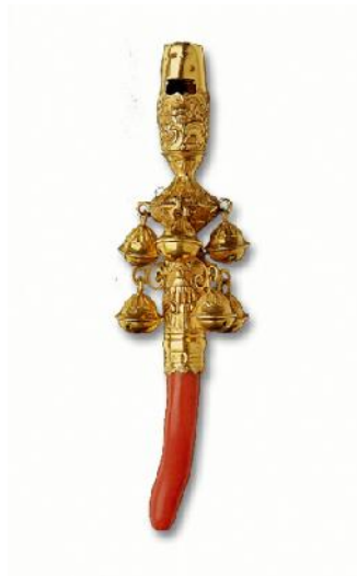
Hochet en or et corail, Angleterre, XVIII e siècle – Bibliotheca Wittockiana ( http://www.wittockiana.org ) à la page http://ns6348.ovh.net/Residents/wittockiana/Public/index2.php

Par ailleurs, la présence de hochets a été attestée par l'archéologie. À l'époque, ceux-ci étaient construits à l'aide de toutes sortes de matériaux, des plus simples aux plus rares, et prenaient des formes très diverses. Très souvent, ils faisaient office d'amulettes et étaient des objets très luxueux. Jusqu'au XIX e , ils conservèrent ce caractère magique et ostentatoire. Depuis lors, ils sont devenus relativement bon-marché et, à partir de l'introduction du plastique, ont été fabriqués à grande échelle. De nos jours, le hochet est devenu le jouet pour bébé par excellence, sollicitant à la fois la vue, l'ouïe, le toucher et même le goût... Miam, le hochet au goût vanille spécialement conçu pour prendre soin des dents de bébé 1 ! À ceux que l'article complet sur le hochet intéresse, cliquez ici.