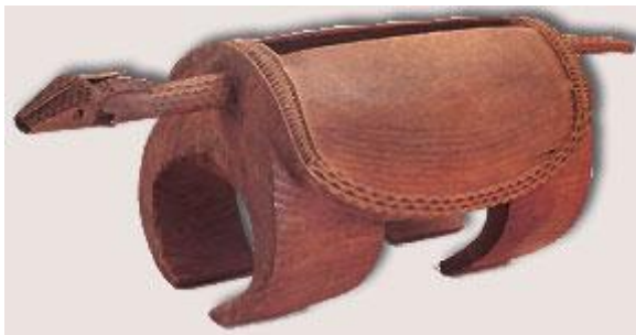
Tambour à fente zoomorphe, Loï, Bas-Ubangi, région de l'Equateur (Congo). Sculpté vers 1895. - Musée de l'Afrique, Tervuren ( http://www.africamuseum.be/ ), à la page http://www.africamuseum.be/museum/permanent/museum/permanent/permetnog1

et tambours font partie de ceux-ci. Des xylophones, balafons 5 , lithophones 6 , sistres 7 , clochettes et grelots sont également mis à disposition des enfants.