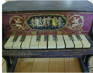
Piano Schoenhut – Collection Pierre Chemin

Ainsi, on pouvait trouver, dans la plupart des familles, une petite trompette, un tambour, une petite guitare, un mini xylophone voire chez les plus chanceux, un piano ou un orgue miniature. La boîte à musique et l'automate avaient également un grand succès.