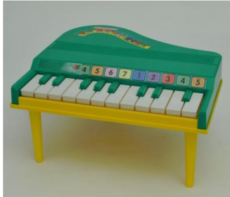
Piano Bontempi – Collection Pierre Chemin.

qui font la qualité d'un jouet musical ou encore, comment éviter les éventuels dangers des jouets musicaux ? Si c'est le cas, je vous invite à consulter le dossier intitulé « Le jouet musical et l'enfant », se trouvant ici.