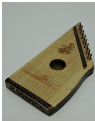
Cithare – Collection Pierre Chemin.

Les Africains produisent également des instruments à cordes, tels que des arcs musicaux. Un enfant peut en jouer dès qu'il sait courir. Les enfants se servent aussi d'harpes simples pour guider leurs chants ainsi que de violes. Par ailleurs, les cithares leur semblent réservées.