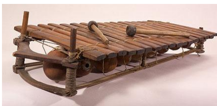
Balafon africain – Museum de Toulouse ( http://www.museum.toulouse.fr ) à la page http://www.museum.toulouse.fr/explorer_3/les_collections_20/ethnologie_79/instruments_musique_1142/balafon_1138/index.html?lang=fr

De manière générale, les enfants d'Afrique utilisent des instruments simplifiés qu'ils construisent eux-mêmes. Ceux-ci, d'une variété innombrables, accompagnent leurs chants, rythment leurs danses et font partie intégrante de leurs jeux. Un article complet concernant les jouets musicaux africains ainsi qu'originaires d'autres régions se trouve ici. N'hésitez pas à y jeter un coup d'œil !